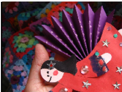
Angelito en papel

Realicemos este hermoso angelito, muy sencillo